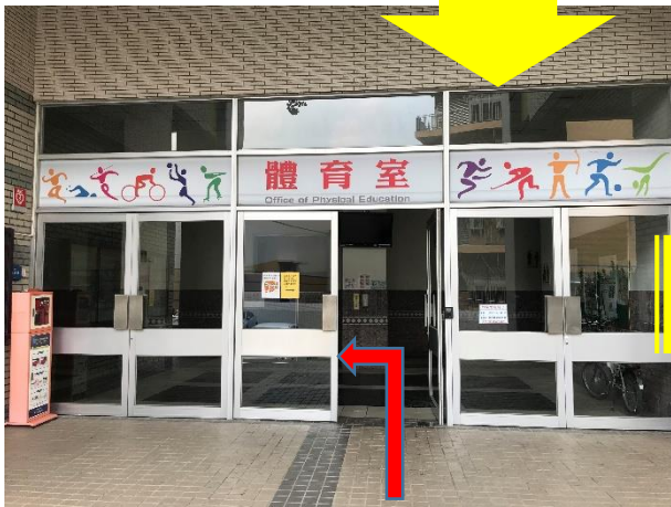
進入青永館東側一樓入口後左轉

收受投標文件地點：本校總務處營繕組 請依地圖路線指示進入青永館東側一樓入口後，左轉搭乘電梯至五樓營繕組投標。