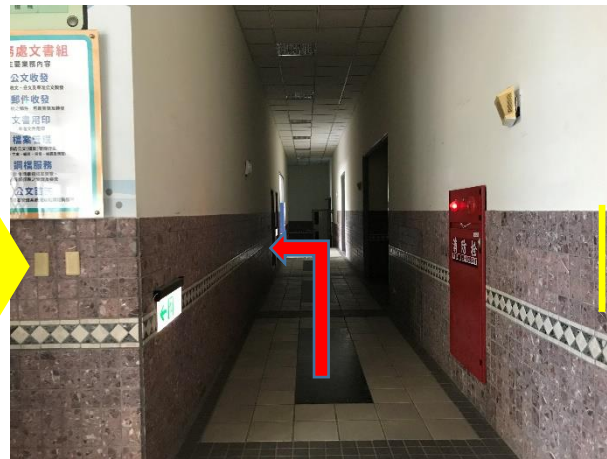
左轉直行到達電梯搭乘至五樓